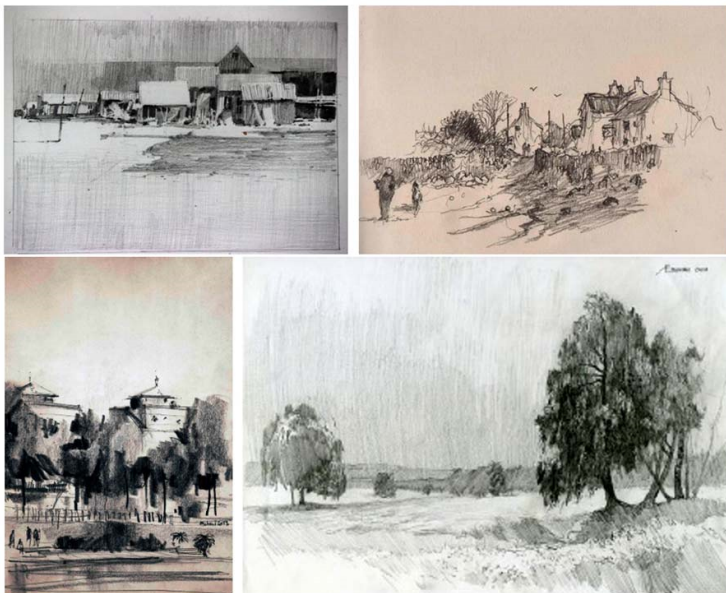
Пример пейзажных зарисовок