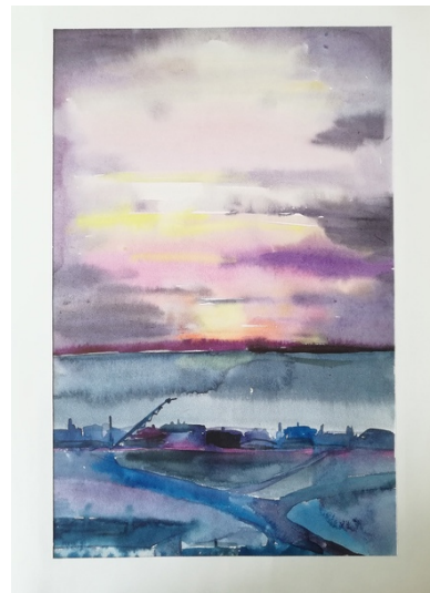
Примеры живописных этюдов