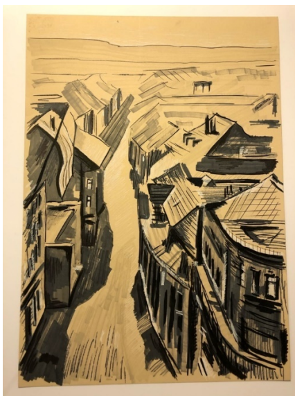
Материал маркер, тонированная бумага.