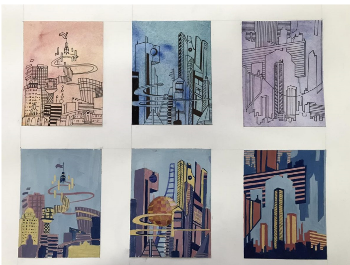
Примеры стилизации архитектуры